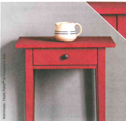
Kommode: Chalk Paint™ in Empower's Silk.

Tipp Um überschüssiges gefärbtes Wachs zu entfernen, verwenden Sie ein wenig Clear Chalk Paint™ Wax auf einem fusselfreien Tuch und reiben Sie damit die Stelle ab.